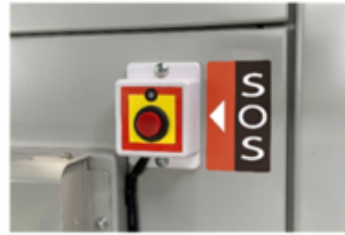
SOSボタン(※オプション)