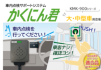
かくにん君(大・中型車用)