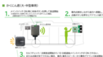
システム、機器構成(かくにん君)