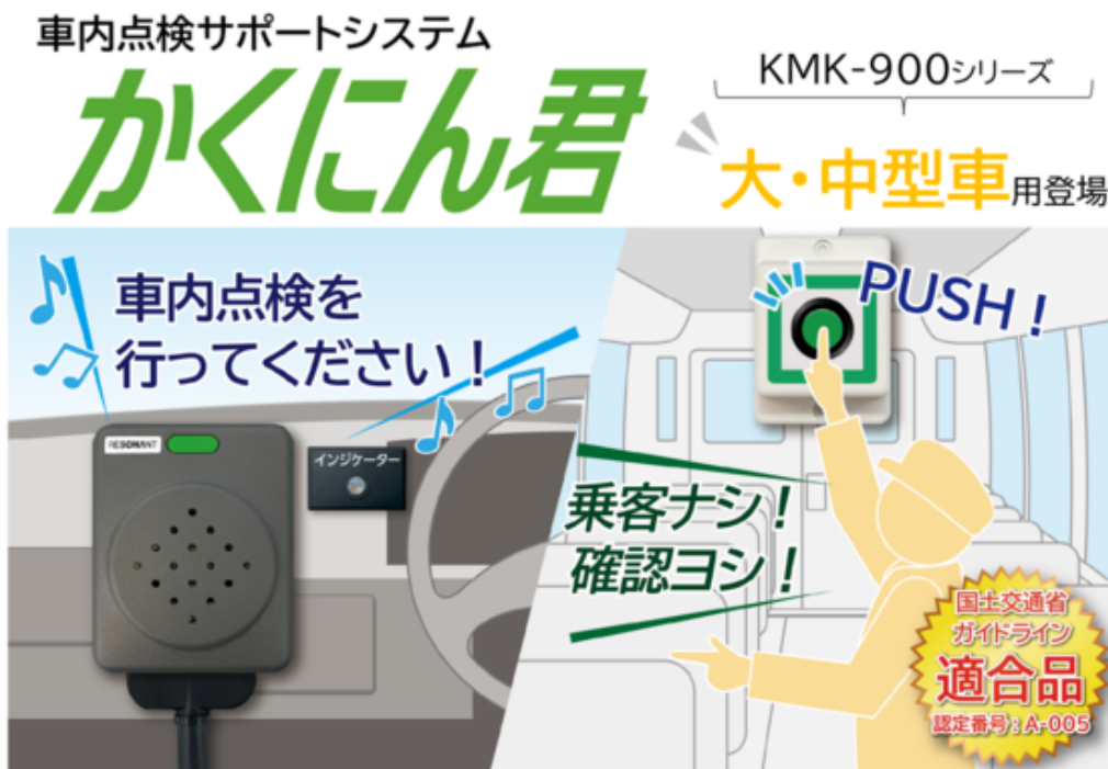
かくにん君(大・中型車用)

昨年の幼児置き去り事故を受け、レゾナント・システムズでは、「送迎用バスの置き去り防止を支援する安全装置のガイドライン(国土交通省)」に適合した、マイクロバス・普通車両向けの車内点検サポートシステム『かくにん君』を2023年2月より販売開始し、2023年3月現在3,000台以上のバスでご利用いただいています。