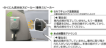
アナウンス(車内、車外)