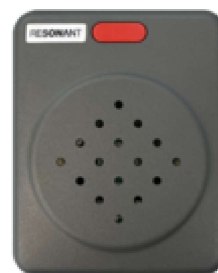
車内点検注意喚起放送装置(KMK-810)