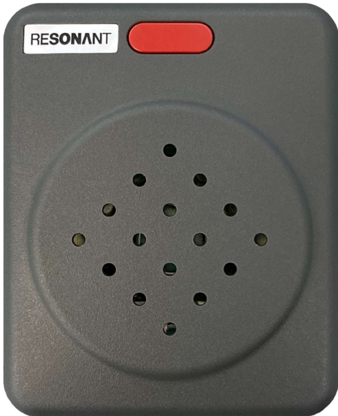
車内点検注意喚起放送装置(KMK-810)